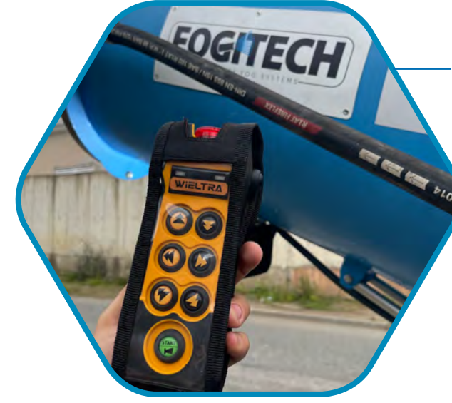
UZAKTAN KUMANDA KONTROL SİSTEMİ