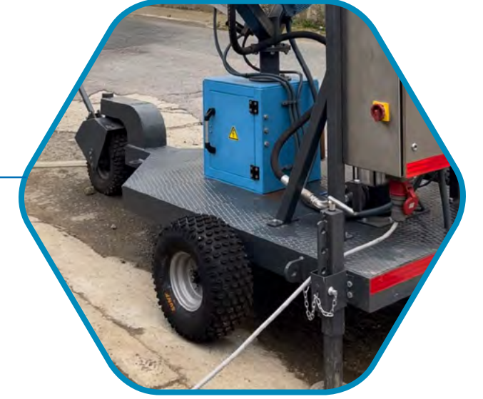
ÜÇ TEKERLEKLİ RÖMORK İLE KOLAY TAŞINABİLİRLİK VE SABİTLEME