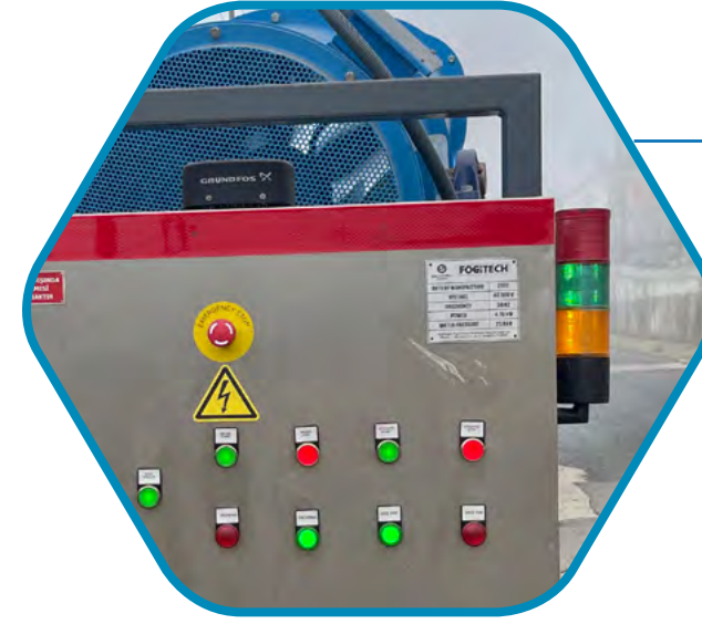
GÖRSEL UYARI SİSTEMİ VE ACİL DURUMLARDA MANUEL KONTROL