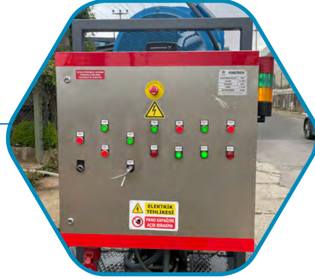
KOLAY KULLANIM KONTROL ÜNİTESİ