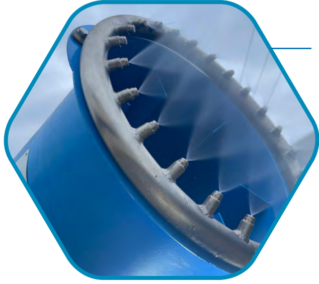
ATOMİZE NOZULLAR VE OPTİMUM SİS OLUŞUMU